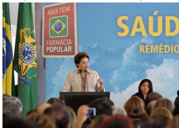
Presidenta Dilma Rouseff discursa durante solenidade de anúncio de medicamentos gratuitos para hipertensão e diabetes